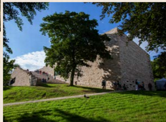
Ausstellungshaus GRIMMWELT Kassel